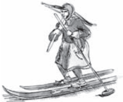
Skandinávský lyžař v šestém století

Zpočátku se pochopitelně nejednalo o lyže v té podobě, v jaké je známe dnes. Používaly se různé druhy sněžnic, které sloužily k chůzi po sněhu. Postupem času se sněžnice zdokonalovaly a chůze se sněžnicemi se měnila ve skluz na lyžích. První písemná zmínka o lyžování pochází z šestého století, kdy Procopius (526–559) psal o skriřinnar (klouzajících Finech). Seveřané zpočátku lyže využívali jako prostředek k přepravě, lovu a boji. Jejich délka byla různá, kratší lyže měla skluznou plochu pokrytou kožešinou a používala se k odrazu, delší lyže byla hladká a sloužila pro skluz. Jízda na takových lyžích se pravděpodobně podobala jízdě na koloběžce. Pro lepší udržení rovnováhy lyžař používal jedinou dlouhou tyč, kterou držel v obou rukou.