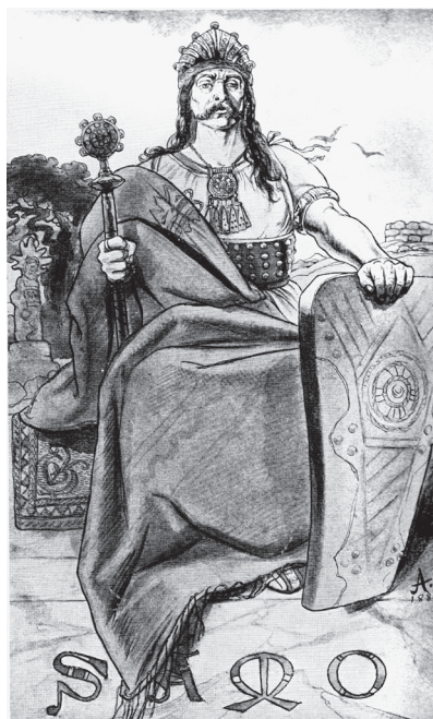
Kníže Sámov představě Mikoláše Alše

záležitosti a dohodu. Přece jen mu záleželo na dobré pověsti své říše. Namyšlený Dagobertův vyjednaváč Sicharius ale jiné urovnání než tučnou náhradu odmítl se slovy, že „není možno, aby křesťané a sluhové boží mohli uzavřít přátelství se psy“. To byla od něj pořádná drzost a Sámov rázem zapomněl, že je původem také Frank. Jménem všech Slovanů se urazil a vmetl Dagobertovu vyslanci do očí velmi ostrá slova, která si tento za rámeček jistě nedal: „Jestliže vy jste sluhové boží a my jsme boží psi, tu když vy ustavičně proti němu jednáte, nám je dovoleno trhat vás svými