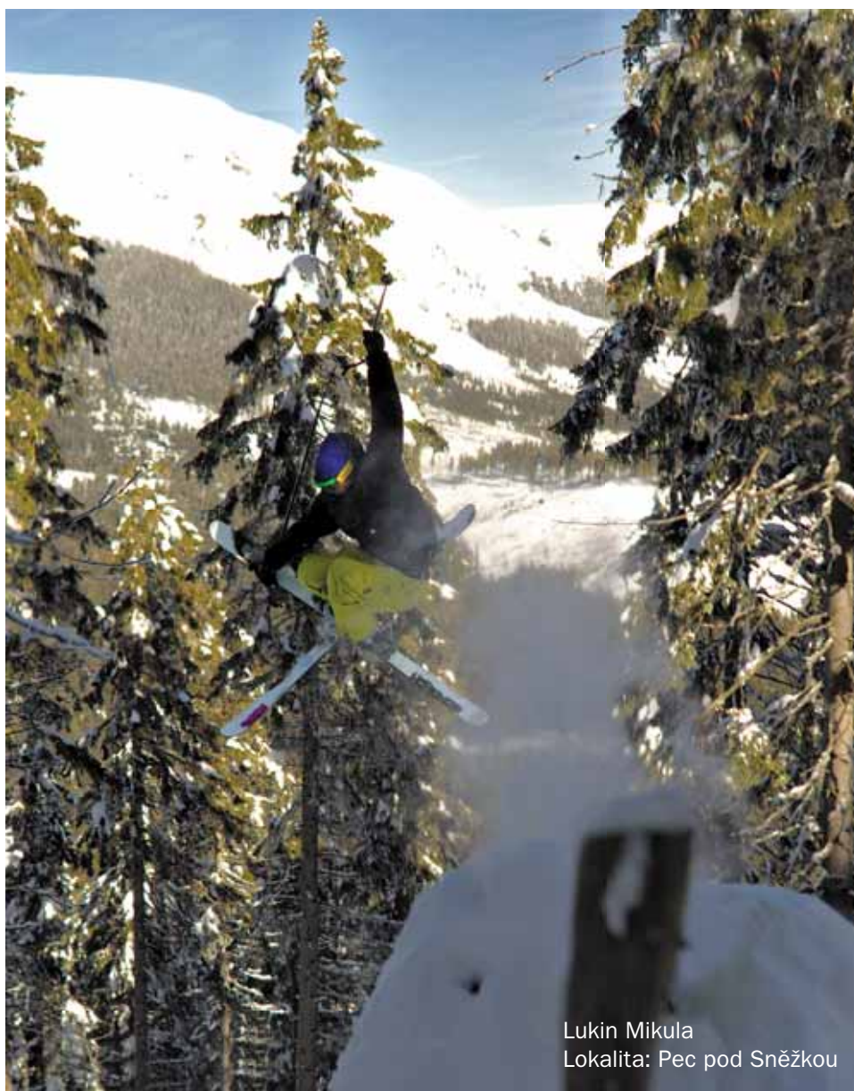
Lukin Mikula Lokalita: Pec pod Sněžkou

se také využívá ke stavbě skoků s přistáním přímo do neupraveného dopadu. Backcountry terény jsou často vhodné pro učení se novým trikům, právě díky měkkému dopadu. Skoků do neupravených terénů se pro jejich popularitu a diváckou atraktivitu často využívá při natáčení profesionálních freeski filmů.