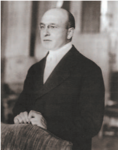
Obr. 2.1 Alexis Carrel (1873–1944), francouzský průkopník srdeční a cévní chirurgie

Zvažujeme-li přínos nové metody, je vždy cenné posouzení v kontextu s dosavadním vývojem. Cévní chirurgie je jedním z chirurgických oborů s největší dynamikou rozvoje: dala vzniknout novým disciplínám (kardiochirurgie, transplantační chirurgie) a ovlivnila a urychlila vývoj dalších operačních oborů. A. Carrel ( Gregor, 1985, obr. 2.1 ) je považován za objevitele cévního atraumatického stehu a zakladatele experimentální chirurgie v oblasti cévní a transplantologie. Stimulem Carrela pro jeho experimentální práce na cévním systému byl atentát na prezidenta Francie Sadi Carnota. V té době totiž nedokázal žádný z tehdejších chirurgů ošetřit po atentátu poraněnou portální žílu a toto poranění se stalo pro prezidenta smrtelným.