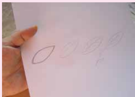
V druhé fázi si na papír předkreslíme tužkou motiv, a ten se pak snažíme cantingem nebo štětcem přesně obtáhnout