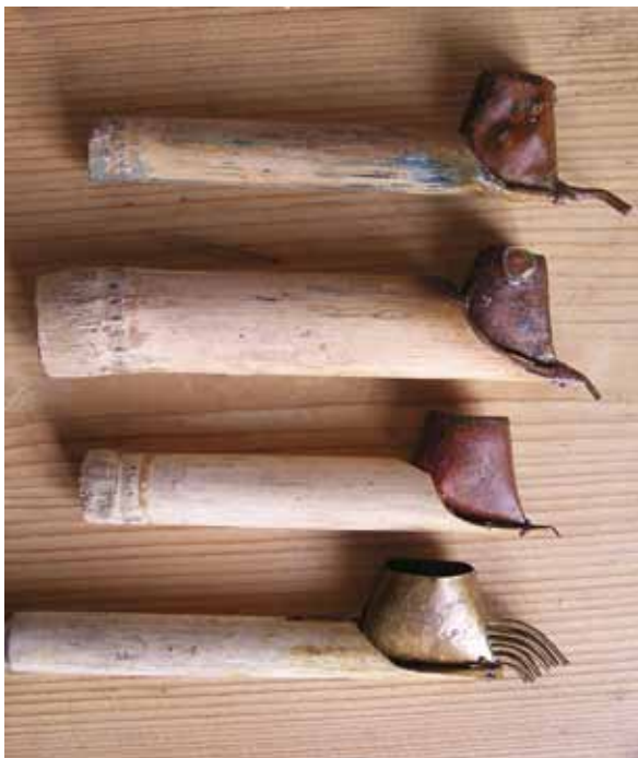
Cantingy mají různé průměry i počet trubiček, kterými vytéká vosk ven

Canting je tradiční nástroj na ručně malovanou batik, tzv. Batik Tulis , používaný na Jávě, ale i jinde ve světě. Jávánské cantigy však patří mezi nejlepší. Jedná se o měděnou nádobku s bambusovou nebo dřevěnou rukojetí a s malou trubičkou, kudy vytéká roztavený vosk ven. Cantingem na látku do slova malujeme, nebo přesněji řečeno – píšeme ( Batik Tulis , indonéské slovo tulis = psát). Trubičky mají různé průměry, a proto s nimi můžeme vykoulit jemné linie a tečky, ale také pokrývat i velké plochy voskem. Vše závisí na tom, jaký průměr trubičky zvolíme. Materiál, ze kterého je canting vyrobený má velmi dobré tepelné izolační vlastnosti a vosk, který do cantingu nabereme, v něm vydrží relativně dlouho horký.