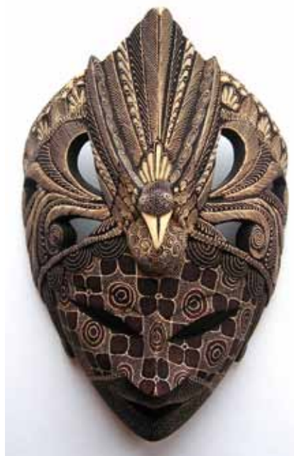
Batika na dřevě, Topeng – maska, umělecký suvenýr inspirovaný tradičními rituálními maskami

Batikování je velmi náročný a zdoluhavý proces, který vyžaduje velkou zručnost. Samotné slovo batik vzniklo složeninou javánských slov amba = psát a titik = tečka. Nejvíce ceněný je tzv. Batik Tulis ( tulis = psát), ručně malovaný batik , při kterém se vosk na látku nanáší pomocí nástroje canting (čti čanting), měděné nádoby s bambusovou rukojetí. Do této speciální nádoby se nabírá roztavený vosk, který trubičkou vytéká ven. S pomocí tohoto nástroje je možné na podklad doslova psát a vytvářet tak neuvěřitelně jemné vzory.