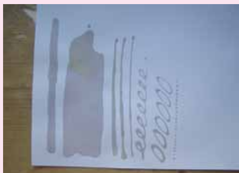
Malujeme různé linky, vlnky, kolečka, spirály, tečky

TIP: Než začneme malovat voskem na látku je dobré když si vyzkoušíme první tahy na papíře. Postačí obyčejný kancelářský papír nebo staré noviny