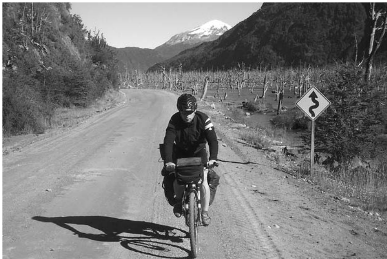
Obr. 5 Trekkingové kolo v plné výbavě

Hodláme-li se věnovat rekreační cyklistice, cyklistice „z práce a do práce“, budeme-li při krátkých či dlouhých několikadenních výletech poznávat kouty naší republiky nebo podnikat „expediční výjezdy“ do zahraničí, pak kolo trekkingové splní naše očekávání. Horské kolo bylo a stále je módním trendem. Koupit si „horáka“, protože to zrovna „frčí“, s tím, že budu jezdit jen po silnici, ale opravdu není ta nejvhodnější volba.