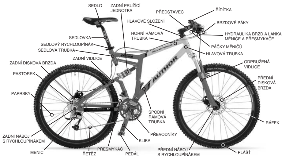
Obr. 6 Popis jednotlivých částí kola