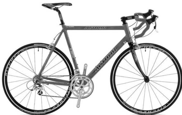
Obr. 2 Silniční kolo