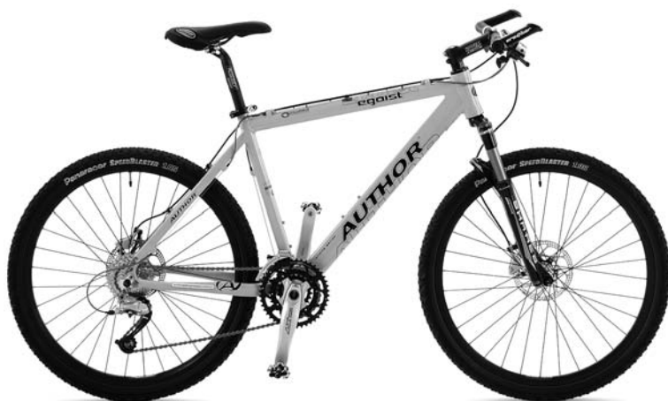
Obr. 3 Horské kolo – MTB