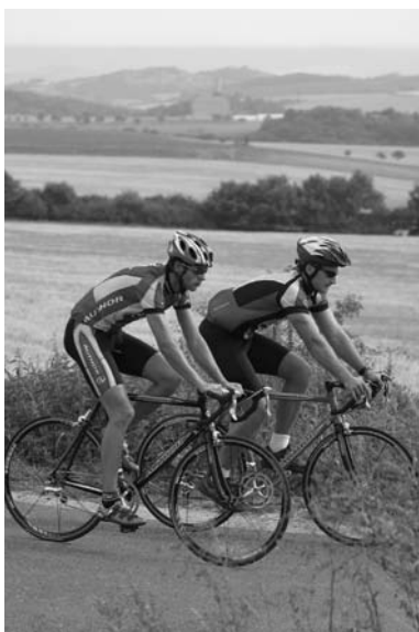
Obr. 1 Jízda na kole je POHODA

Člověk, který neumí jezdit na kole, je takovou výjimkou jako člověk, který neumí číst a psát. Lze namítnout, že to platí také např. o běhání. Běhat ale nemůže každý, kdežto cyklistika je činnost vhodná zejména pro ty, kdo mají nějaké to kilo navíc. Při běhu se celá hmotnost těla při došlapu přenáší na klouby dolních končetin, zatímco při jízdě na kole jsou klouby dolních končetin zatěžovány nepoměrně méně.