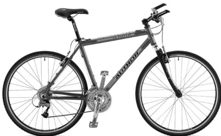
Obr. 4 Trekkingové kolo

Člověk je tvor vynalézavý, a tak se pokusil vymyslet kolo, které by umožňovalo lehký pohyb na silnici a nebránilo se terénu. Výsledkem je kolo trekkingové (obr. 4). Rám není tak robustní jako u horského kola, horní rámová trubka je vodorovná nebo s mírným slopingem (zešíkmením). Průměr kola odpovídá kolům silničním (27 až 28 palců). Řídítka, převody i způsob řazení jsou stejné jako u MTB. Rozdíl najdeme v šířce pláštěů – jsou užší než u horského kola a širší, než mají kola silniční, mají hrubší vzorek, ale ne tolik jako kola horská. To usnadňuje jízdu na silnici. Jízdu po rozbitých cestách zpříjemní odpružená přední vidlice, která ovšem není určena pro divokou jízdu korytem potoka.