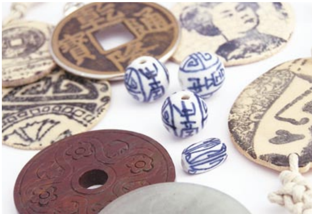
☞ porcelánové korálky, kamenné donuty, replika čínské mince a keramické medailonky

Jadeit je jednou z odrůd nefritu, která se stala symbolem míru a klidu. Pro Číňany představoval jadeit symbol pěti hlavních ctností: moudrosti, spravedlnosti, milosrdenství, skromnosti a odvahy. Nefrit jako takový byl základním drahým kamenem čínské civilizace a byl synonymem pro slovo drahokam. Jednou z hlavních schopností, připisovaných nefritu, je podpora soudružnosti, ochrana zdraví a pročisťující schopnosti. Znak, používaný pro nefrit, se také dá přeložit jako „hluboký smysl věcí“.