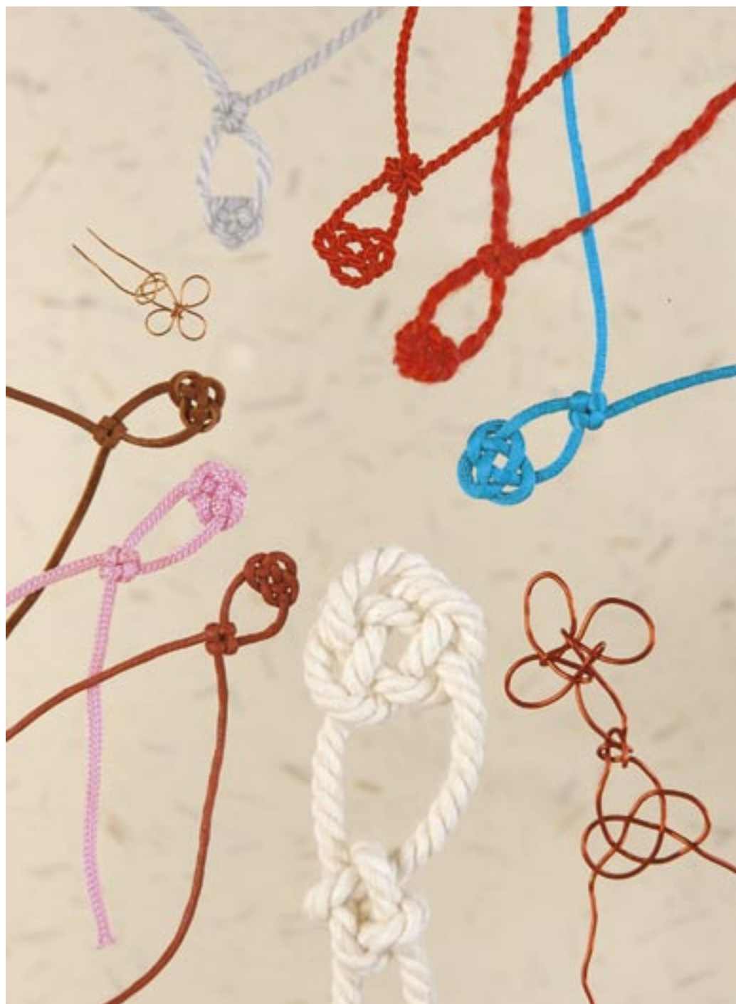
rozdíly ve vzhledu uzlů