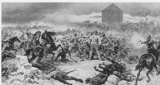
Bitva na Bílé hoře (Schlacht am Weissen Berg), 8. 11. 1620