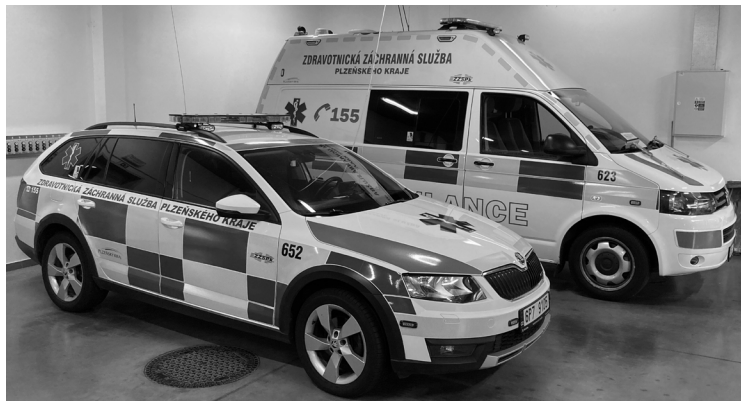
Obrázek 2: Vozidlo RV a RZP