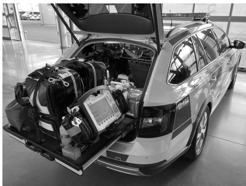
Obrázek 13: Vůz posádky RV