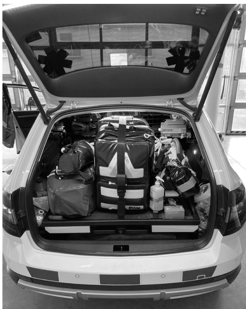
Obrázek 14: Vůz posádky RV