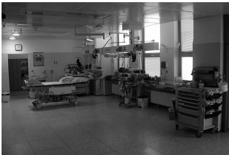
Obrázek 17: Emergency