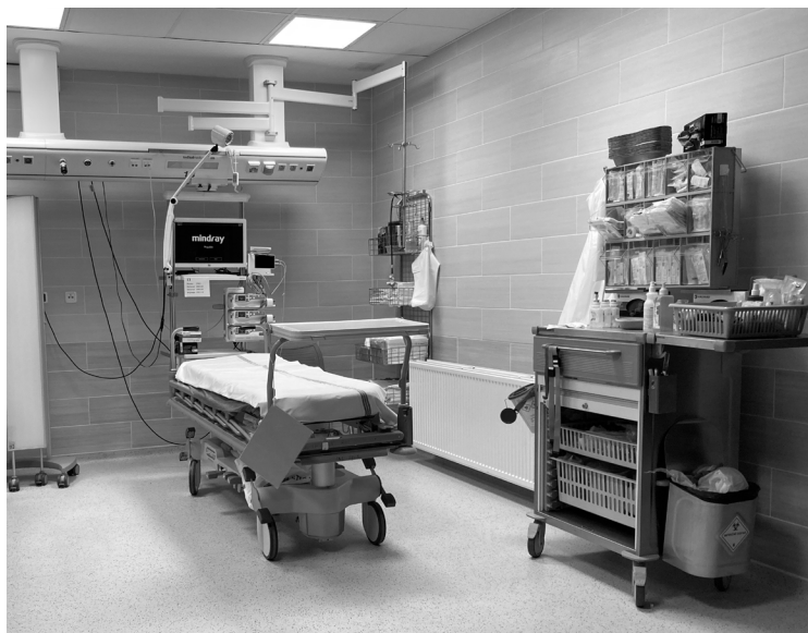
Obrázek 16: Urgentní příjem

nejrůznějších odborností a specializací, jejichž dostupnost musí být zajištěna nepřetržitě. Na pracovištích emergency jsou pacientům zajištěny základní vitální funkce, jsou provedeny některé urgentní intervence vč. diagnostiky v rámci přípravy na operační či jiný zákrok, popř. jsou provedeny přímo život zachraňující výkony, které nesou žádného odkladu. Bývá zde zahájena farmakologická či infuzní léčba, jsou podávány krevní deriváty apod. Takto zajištěný pacient bývá pak obvykle dále předáván na operační trakt k dalšímu řešení daného problému, popř. na oddělení ARO či jednotky intenzivní péče (JIP). Ilustrační foto pracoviště urgentního příjmu a pracoviště emergency viz obrázek 16 a 17.