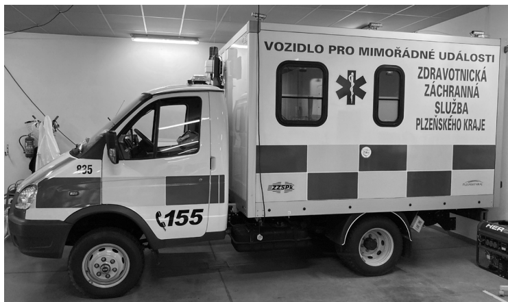
Obrázek 15: Vozidlo pro mimořádné události