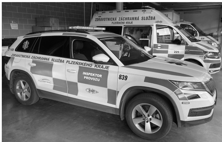
Obrázek 1: Vozidlo inspektora provozu