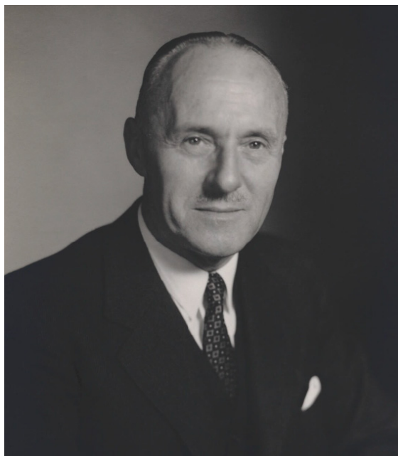
Obr. 1.4 Claude Dixon

Přední resekce rektá s anastomózou je v klinické praxi často označována jako tzv. Dixonova operace ( resectio recti sec Dixon ) nebo Mayo Clinic operace. Dixon velmi výstižně definoval hlavní přínos tohoto výkonu: „technika, jejímž cílem je zachovat pacientovu kvalitu života prostřednictvím obnovení kontinuity GIT bez kompromitace onkologické radikality výkonu“. Dixonova operace nahradila abdominoperineální amputaci zprvu pouze u pacientů s karcinomem orální třetiny rektá, později také u pacientů s karcinomem střední a aborální třetiny rektá. 16