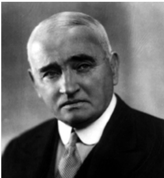
Obr. 1.2 William Ernest Miles

a v blízkosti bifurkace levé arteria iliaca communis . 12 Tyto oblasti označil jako zóny šíření karcinomu směrem nahoru („ upward zone of spread “). Miles pochopil, že exstirpace rekta perineálním přístupem není dostatečně radikální, protože neřeší příčinu lokální recidivy (nekompletní excize mezorekta a jeho lymfovaskulárního zásobení). Navrhl proto onkochirurgicky radikální operaci abdominoperineálním přístupem s cílem odstranit rektum společně s jeho lymfatickou drenáží. Vzhledem k velmi vysoké pooperační mortalitě kombinovaného operačního přístupu (až 42 %) byl operační výkon prováděn ve dvou dobách – abdominální a perineální fáze operace.