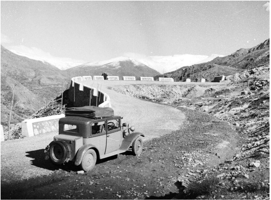
Auto na silnici v pohoří Sierra Nevada