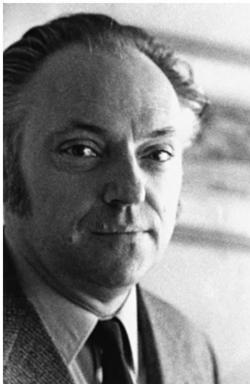
Jan Zábrana, 70. léta