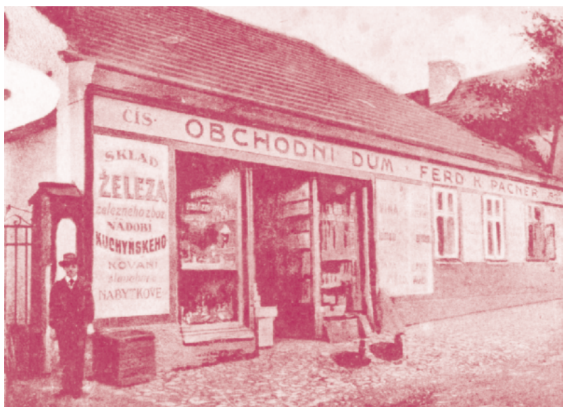
Obchod dědečka a později tatínka v Harantově ulici v Janovicích nad Úhlavou ve dvacátých letech

Tatínek byl zcela zavalený prací, věnoval se jí od rána do večera a na noviny měl čas jen během oběda. Zato já do nich neustále nahlížel a četl si v nich. Začalo to zřejmě