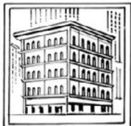
Spolek hádkářů a luštitelů staré yorské šifry