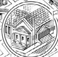
Ambasáda pěti set národů