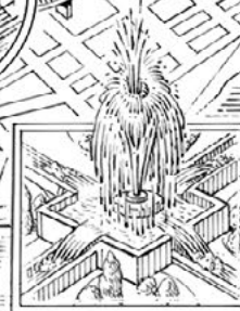
kašna Croton Fountain