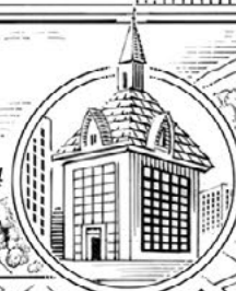
Západní 73. ulice č. 354