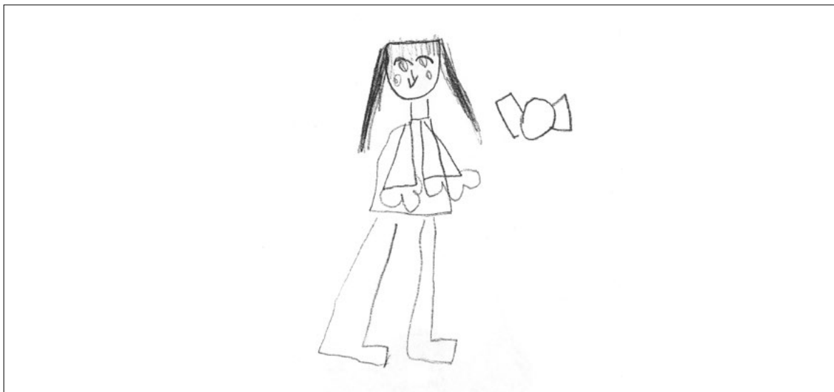
Kresba lidské postavy. Jedná se o kresbu děvčátka (6,2), jehož psychometricky zjištěný intelekt odpovídá ve složce verbální i neverbální horní hranici pásma hlubokého podprůměru.