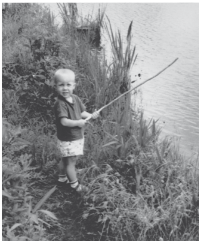
Autor coby dvouletý capart loví podomácku udělanou rákoskou.

Smyslem této knihy je nejen pobavit a upoutat, ale zároveň snad poslouží jako historický záznam neobyčejného sportovního odvětví, jímž je rybaření. Ustavičně žasnu nad tím, co se může stát, když háček dopadne do vody,