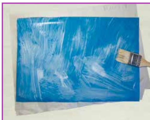
Obr. 3.3 Natírání potahu lepidlem