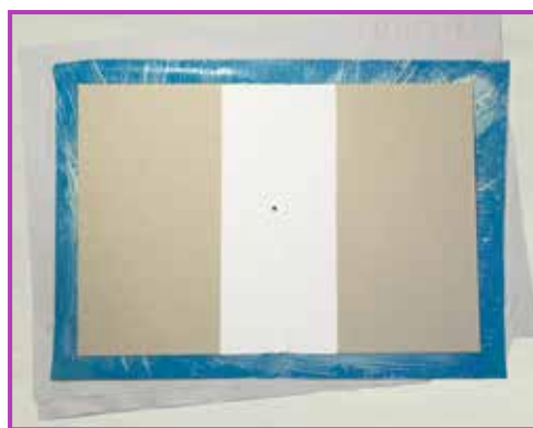
Obr. 3.4 Na připravený potah položíme desky