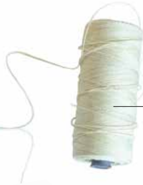
režná nit (100% lněná nit)