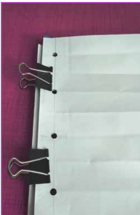
Obr. 4.4 Využití pomocného papíru a binder klipů pro proděravění knižního bloku