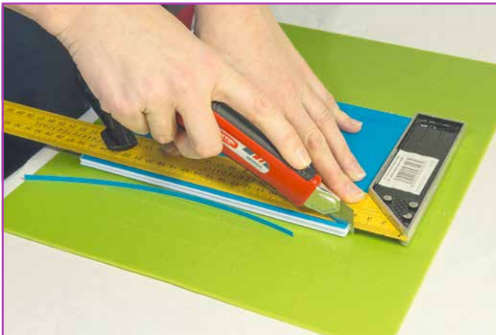
Obr. 3.10 Řez vedeme nožem podél připevněného pravítka