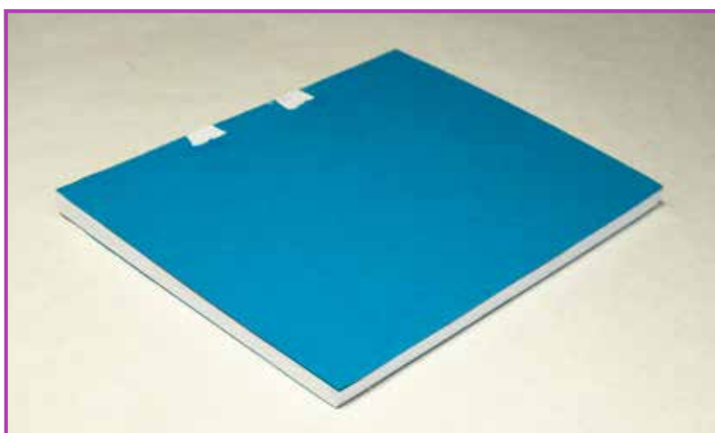
Obr. 3.13 Knižní blok s hladkou ořízkou

Podél pravítka poté vedeme plynulý řez nožem tak, že postupně odkrajujeme vrstvu papíru za vrstvou, dokud neodřízneme poslední vrstvičku a nemáme oříznutou celou stranu. Nikdy se nesnažíme uříznout najednou celý knižní blok, nepodaří se to. Je potřeba vyvíjet rukou na nůž stejnoměrný tlak a nožem tlačit kolmo dolů ke knize a zároveň mírně přitlačovat k pravítku. ( Obr. 3.10, obr. 3.11, obr. 3.12 )