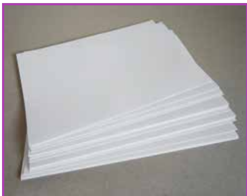
Obr. 4.1 Naskládání papíry na knižní blok

Pro svázání lze použít jakoukoli nit, provázek, stužku apod. Výhodou však bývá, pokud je možné ji navléci na velkou jehlu, usnadní to prostrkávání dírami. Naměříme délku nitě 4 až 5× delší než je délka hřbetu vaší knihy. Knihu si srovnáte hřbetem před sebe a přední stranou dolů (směrem k podložce). (Obr. 4.5)