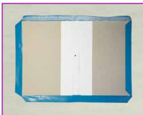
Obr. 3.5 Odstráníme nůžkami růžky

Na prostředek natřeného papíru položíme knižní desky orientované tak, aby pomocný pruh papíru, na kterém jsou zavěšené, směřoval k nám. (Obr. 3.4)