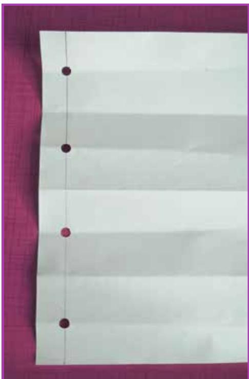
Obr. 4.3 Pomocný papír pro rozvržení děr