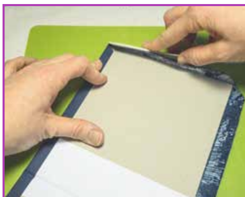
Obr. 3.7 Zakládání „růžku“