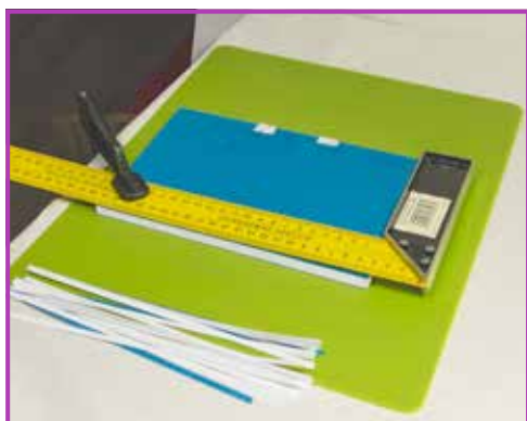
Obr. 3.12 Vznikne hladká ořízka