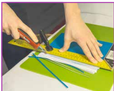
Obr. 3.11 Postupně ukrajujeme vrstvu za vrstvou