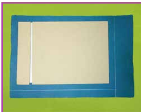
Obr. 3.2 Vyměření velikosti potahu