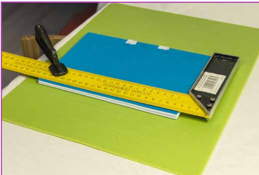
Obr. 3.9 Knížní blok připravený k ořezu