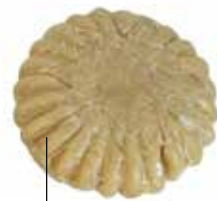
včelí vosk (na navoskování nití)