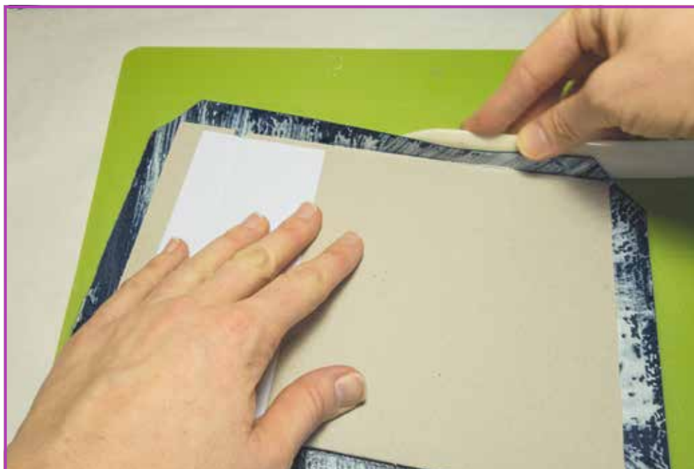
Obr. 3.6 Zakládáme okraje pomocí kostky