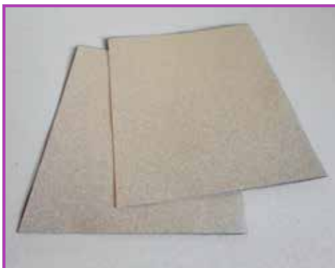
Obr. 4.2 Naskládání kartony na přední a zadní desku