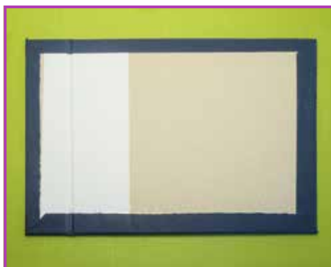
Obr. 3.8 Potážená knižní deska, při pohledu na vnitřní stranu vidíme založené okraje

potřeba pouze opravdu ostrý nůž, kovové pravítko, svěrka a podložka na řezání.