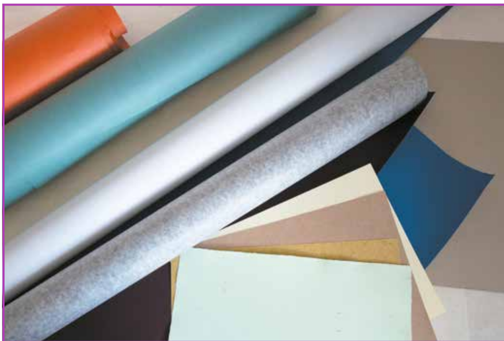
Obr. 1.1 Materiál na výrobu a potah knižních desek

Při lepení papírových materiálů k sobě vždy platí zásada, že vlákna všech materiálů musí vést stejným směrem. Tím se zajistí, že se po slepení nebudou vlnit kvůli působení protitahu vláken jdoucích různými směry.