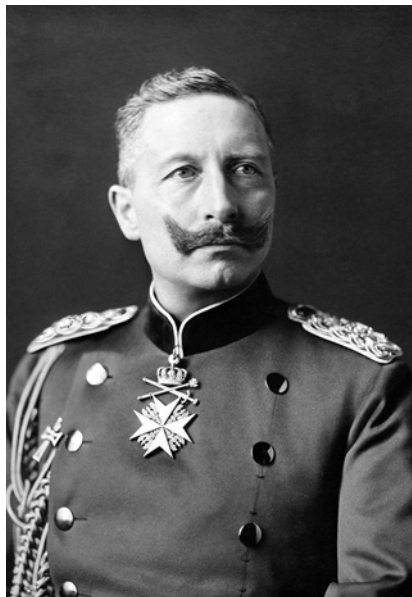
Vilém II. (1859–1941) byl posledním německým císařem a pruským králem. Vládl od roku 1888 do 9. listopadu 1918, kdy abdikoval. Zbytek života strávil v nizozemském exilu (sbírka ČsOL).

Navzdory veškerým důvodům ke sporu nabídla Velká Británie Vilému II. spojenectví, jež v předcházejících desetiletích kvůli politice skvělé