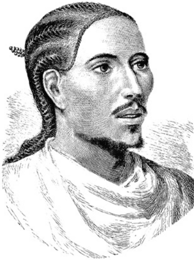
Jan IV. (1837–1889) byl etiopský císař v letech 1872–1889. Vládcem se stal s pomocí Britů, kteří mu však odmítli pomoc s nároky Itálie. Byl smrtelně raněn v bitvě s mahdisty.

Dne 25. ledna 1887 napadla etiopská armáda čítající 10 000 mužů malou posádku v Saati, ale její útok byl odražen. Velitel posádky major Boretta neměl dostatek lidí ani munice, a proto požádal posádku v Moncullu o posily a doplnění zásob. Dne 26. ledna 1887 se kolona 430 italských vojáků pod velením podplukovníka De Cristoforise vydala po silnici do Saati, poblíž Dogali padla do léčky a byla kompletně zničena. Logickým důsledkem bylo okamžité stažení italských oddílů z posádky v Saati, která padla do etiopských rukou. Tato porážka vyvolala širokou odezvu nejen v Itálii a rozpoutala protesty proti koloniální politice tehdejší vlády, po nichž ministr zahraničních věcí hrabě Carlo Felice Nicolis di Robilant (1826–1888) podal demisi.