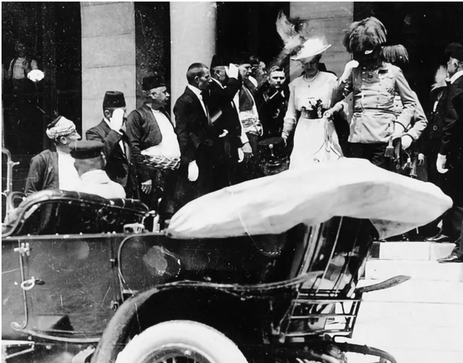
Odjezd arcivévody Františka Ferdinanda d'Este a Žofie Chotkové od sarajevské radnice před atentátem 28. června 1914.

V 10:15 hrozil první atentát: člen organizace Černá ruka ( Crna ruka ) Muhamed Mehmedbašić byl připraven ke střelbě z domu, kolem nějž průvod projížděl. Ale jelikož na něj neměl volný výhled – jak později tvrdil –, raději zbraň nepoužil, aby neohrozil provedení celého