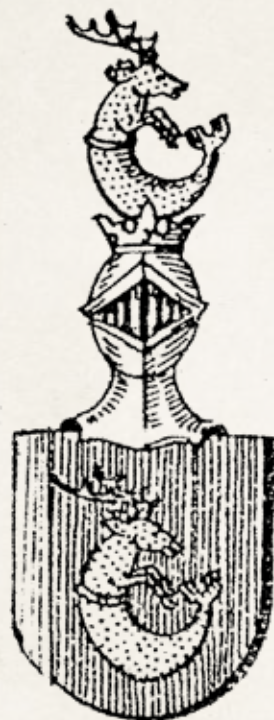
Obr. 1. Znak pánů ze Šenova.

„Šašek“ ze Šenova dosáhl na dvoře těšínského knížete Přemysla I. Nošáka významného postavení, byl jeho maršálkem, hejtmanem na Velkém Hlohově. „Sasske, hauptman czu Grossen Glogow“, 3 tak je zapsán dne 30. 7. 1392 jako svědek prodeje Velkých Ocháb. Jistý Šašek de Mosgrund je na Těšínsku připomínán již v roce 1376. 4 Snad mohl být