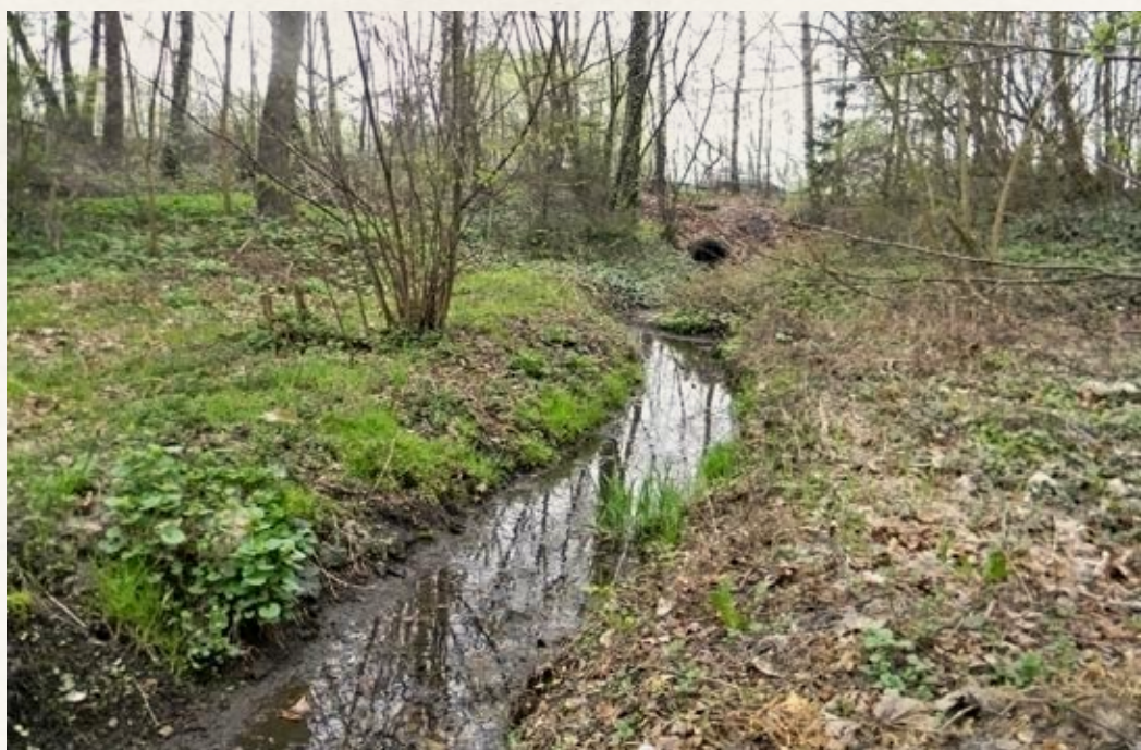
Obr. 4 Pozůstatek strouhy v centru obce u zahrady ak. mal. V. Wünsche pod Zámeckým parkem.