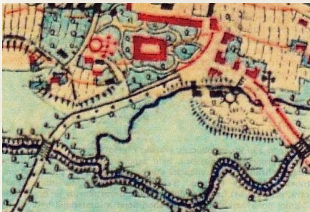
Obr. 3 Detail mapy III. vojenského mapování sestavené mezi léty 1876 – 1878 se zakreslením centra Šenova s kostelem, zámkem, domy v „podzámčí“, s vyznačením mlýna a mlýnské strouhy – siná černá čára.