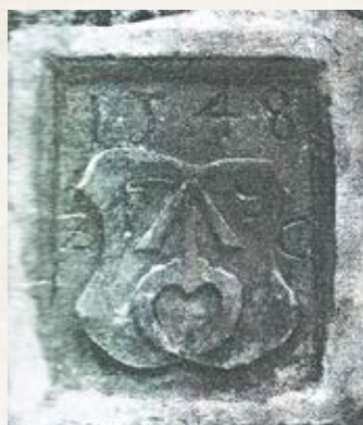
Obr. 2. Kamenná deska s erbem a letopočtem dokončení přestavby ostravského hradu.