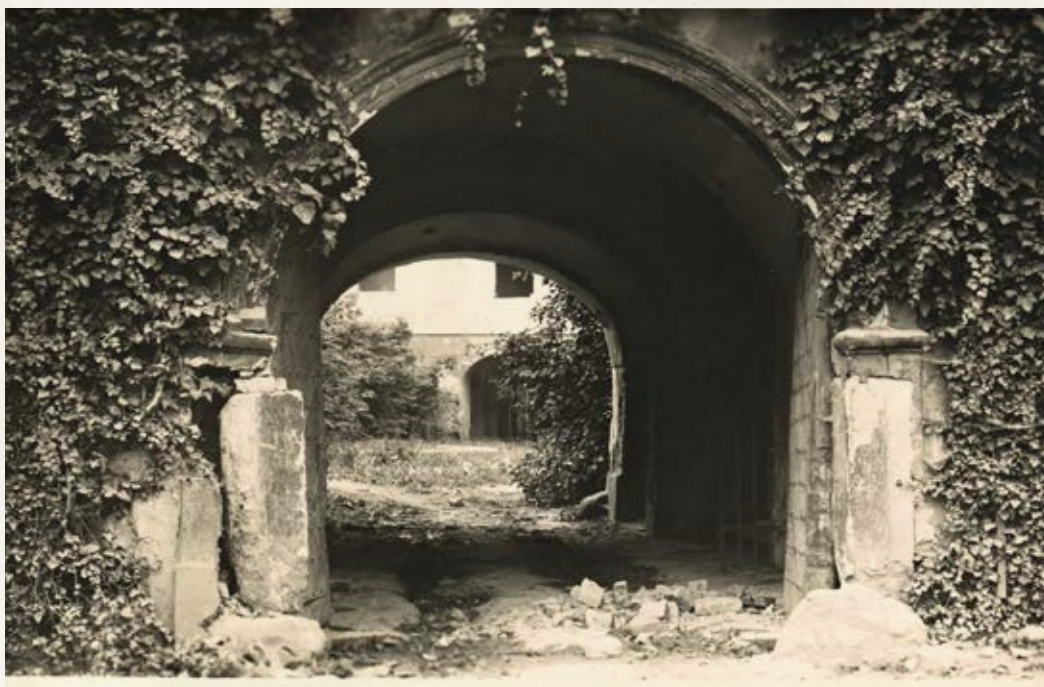
Obr. 1. Renesanční brána šenovského zámku.