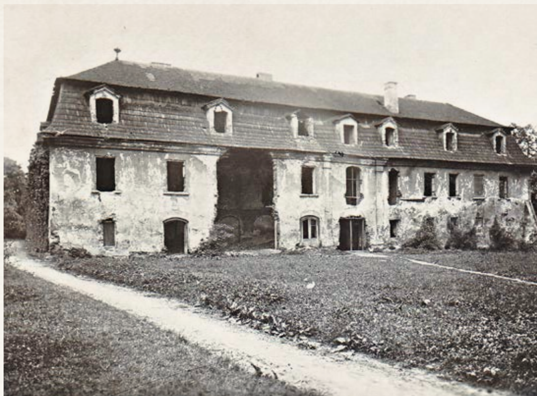
Obr. 3. Západní křídlo zámku je zachyceno na fotografii z dvacátých let 19. století, v době bourání zámku. Také na této straně se v jižní části v přízemí nacházejí menší renesanční okna.

Východním a západním křídlem zámku prostupovaly brány. Je možné připustit, že v určitém časovém období bylo nádvoří zámku z východní a západní strany z části uzavřeno pouze zdí a hradbou, se vstupními bránami.