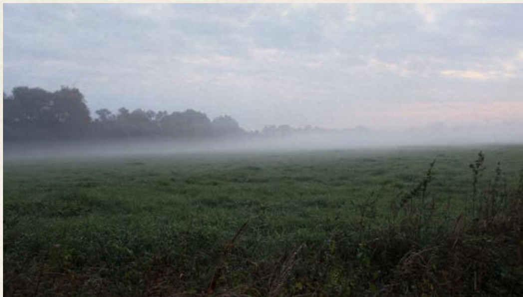
Obr. 1. Mlhy nad šenovskými loukami okolo řeky Luciny.

Nejstarší historie Šenova je zahalená mhou dávných věků, podobnou mlhám, do nichž se čas od času zahalují šenovské louky okolo řeky Luciny.