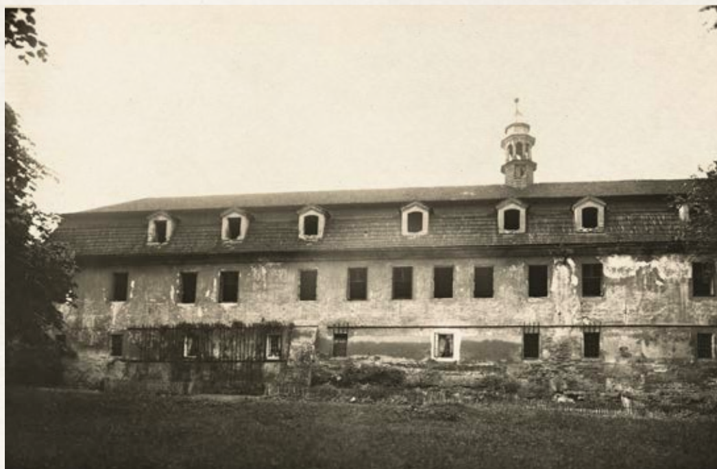
Obr. 2 Fotografie části již zchátralé jižní strany zámku ve dvacátých letech 20. století. Na ní je zřetelně viditelný kamenný základ a na něm vystavěná cihlová zeď.

Zdivo bylo podepřeno, pro renesanční stavitelství typickými zpevňujícími pilíři. Menší okna v přízemí budovy s kamenným ostěním byla opatřena mřížemi.