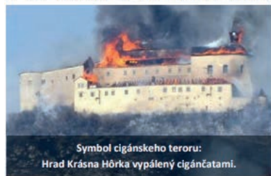
Symbol cigánskeho terorom: Hrad Krásna Hôrka vypálený cigáncami.

Každý zločinec si musí byť vedomý toho, že proti nemu tvrdo nasadíme nielen políciu, ale aj Domobranu! Nebudeme tolerovať ani žiadne čierne stavby. Zlikvidujeme ich všetky - rýchlo a bez rozdielu!