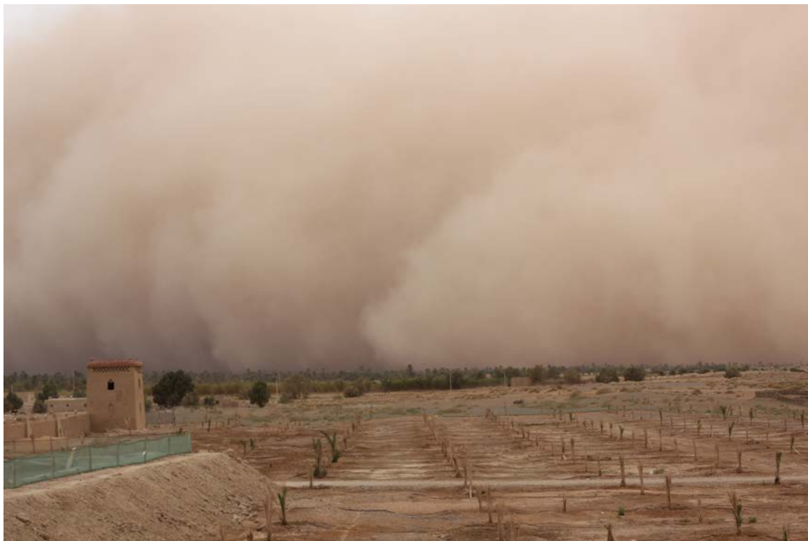
Písečná stěna se pomalu řítí k nám. ▲

třeba jakou jedeme rychlostí. Tripmastery si navíc kalibrujeme sami a ručně, žádná satelitní pomoc. Takže když se spleteme, můžeme skončit bůhví kde.