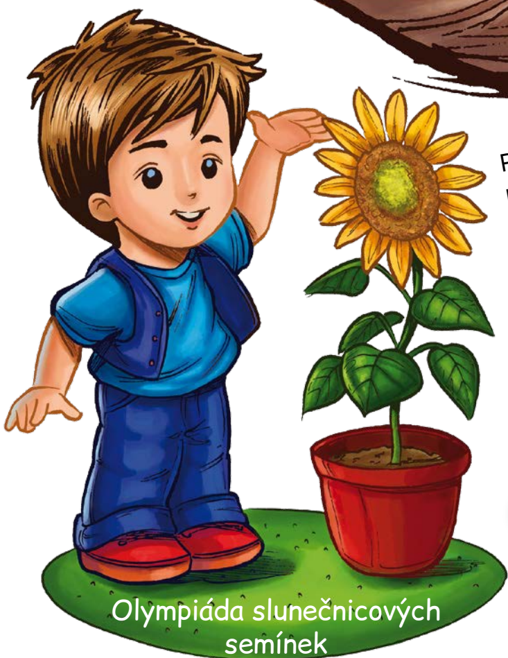
Olympiáda slunečnicových semínek

Prohlédni si tato semínka. Tolik různých tvarů a barev! Semínko máku je tak maličké, že je sotva vidět. Najdeš ho? Porovnej kuličku hrášku s kokosovým ořechem.