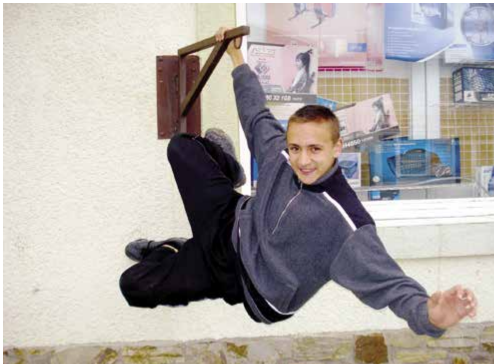
Jedna tréninková fotečka. Byl jsem happy, když jsem nebyl nemocný a mohl jít trénovat.