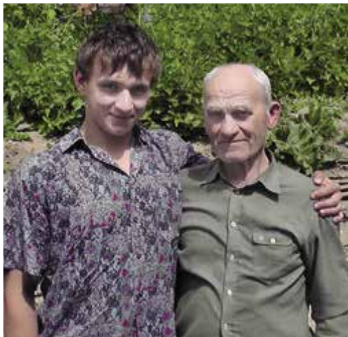
Léto 2011, návštěva příbuzných na Ukrajině. To je ten dědeček, se kterým jsem chodil rybařit. 😊

u nás tou dobou topilo, protože zemní plyn tam ještě v domácnostech zavedený nebyl.