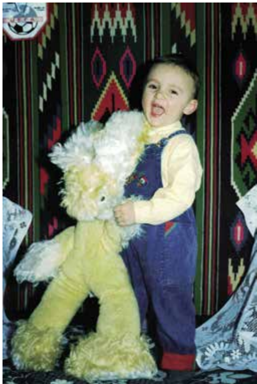
Pravá nefalšovaná dětská radost z maličkosti!

bráškov, holomkov jednomu, věnovali více než mně, a tak jsem pěkně žárlil. Ale těžší to bylo zejména pro moje rodiče.