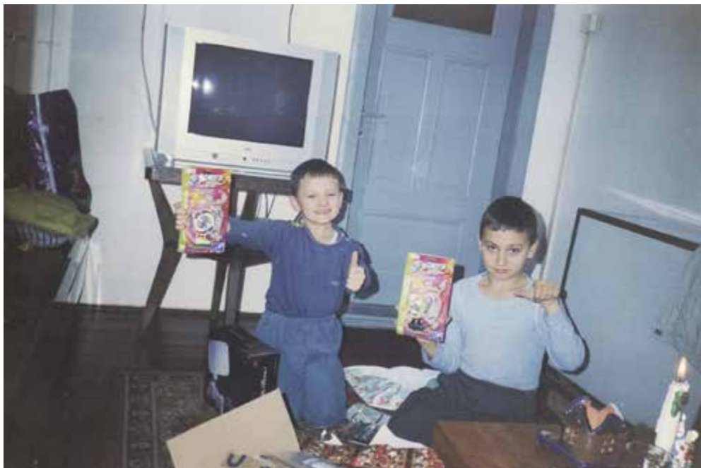
To jsou čínské bejblejdy, které byly tou dobu ve škole mega hit...

Dnes vím, že to tenkrát zařídili naši spolubydlíci, kteří bydleli v pokoji u kuchyně a ten dům s námi měli pronajatý. Naši je vždycky poprosili a všechno na nás takhle hezky sehráli. A my si s bráchou říkali: „Sakra, jak to? Ten Ježíšek asi fakt existuje.“ A nevěřičně jsme se na sebe dívali. A pak jsme spěchali k tomu stromku a byli překvapení, že tam jsou dárky, které tam ještě před chvílí nebyly.