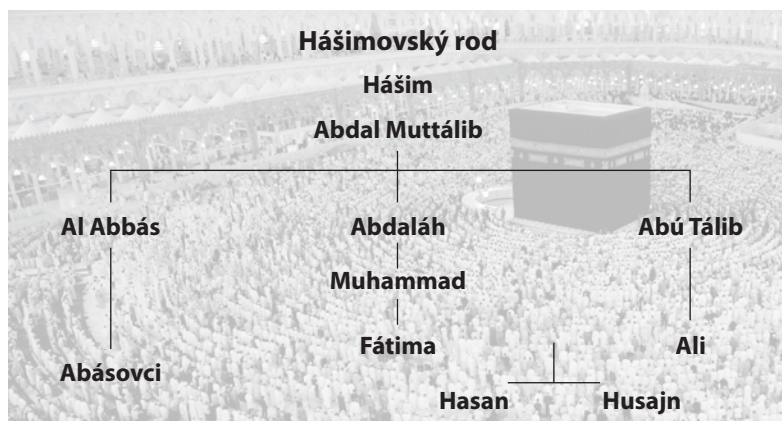
Obr. 1 Hášimovský rod a pozice proroka Muhammada v něm

Po otci byl z rodu Hášimovců (dnes královský rod v Jordánsku) z kmene Kurajšovců. Od šesti let byl sirotek. Otec Abdalláh zemřel před Muhammadovým narozením, matka Ámina v jeho šesti letech. Vychováván byl svým strýcem Abú Tálibem. Hášimovský rod je znázorněn ve schématu na obrázku 1.