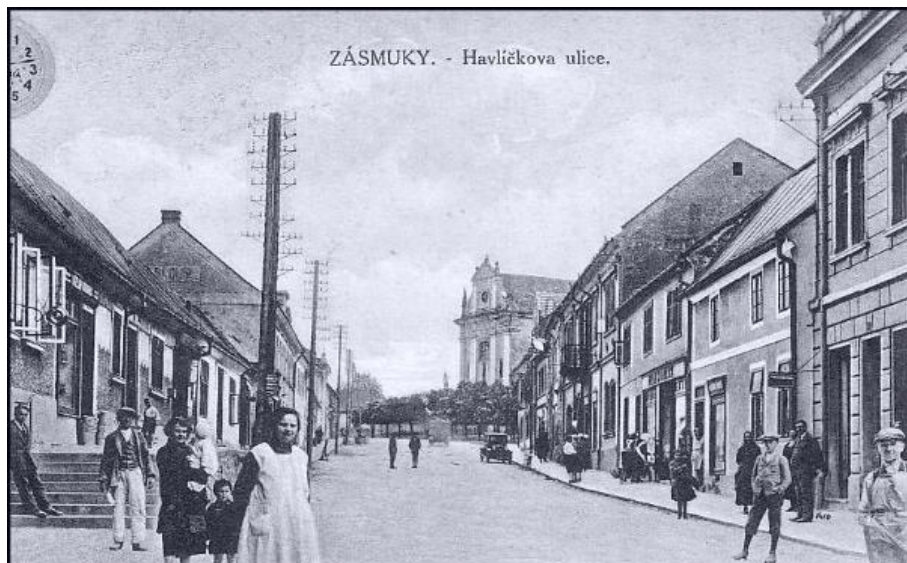
ZÁSMUKY. - Havlíčkova ulice.

Zásmyky v době, kdy jsem tam chodila do měšťanky v letech 1921-1925.