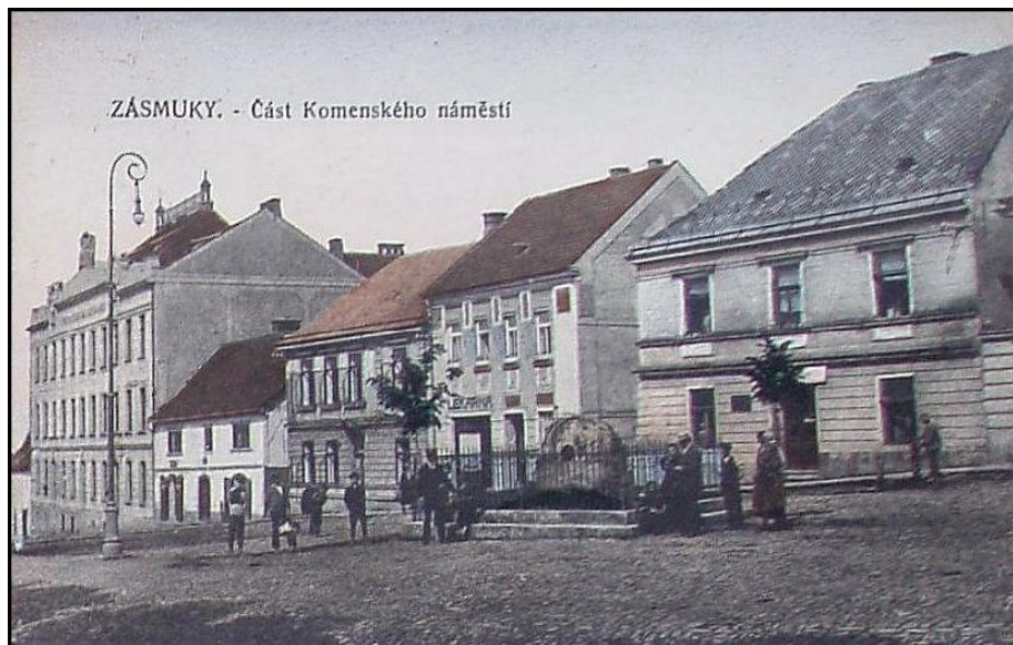
ZÁSMUKY. - Část Komenského náměstí

Zásmyky v době, kdy jsem tam chodila do měšťanky v letech 1921-1925.