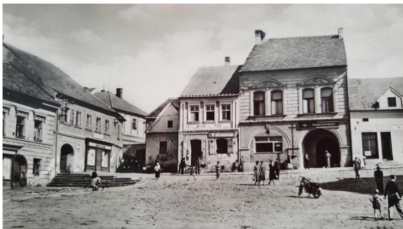
Trhové Sviny mého mládí

Na štěstí se tatínek do roka vrátil živý a zdravý zpět do nově vzniklé Československé republiky. Ve škole se obrazy císaře Karla vyměnily za portrét našeho prvního prezidenta Tomáše Garrigua Masaryka.