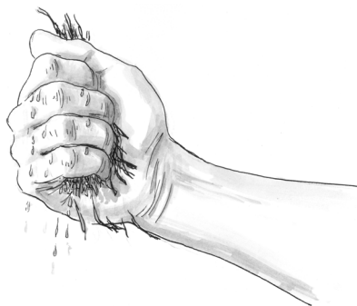
Obr. 4 Materiál je příliš vlhký