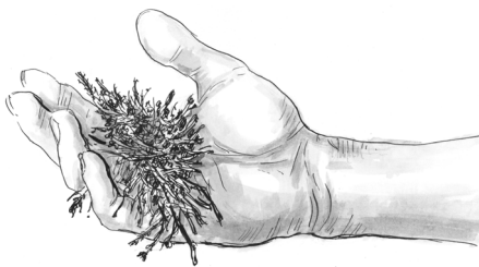
Obr. 3 Materiál je příliš suchý

Orientační zkouška v praxi zcela postačí!