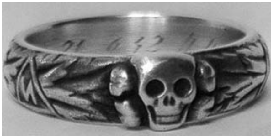
Totenkopfring příslušníků SS (nazývaný prsten se smrtihlavem)

se mu to nepodařilo. Zatímco jsme se z toho vzpamatovávali, muž uprchl.“ Oba ošetřovatelé potvrdili slova sestry Oliveirové. „Je mi to velmi líto, pane doktore,“ dodala a pod vlivem dojmů se znovu rozvzlykala.