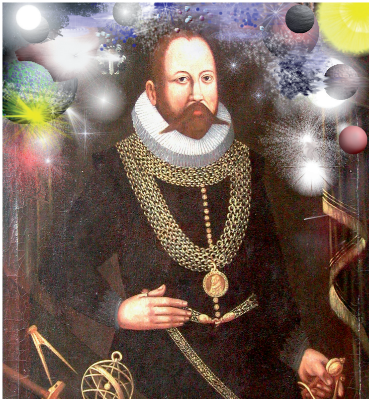
Známa legendární osobnost, která také osobně zavítala do královské Plzně.