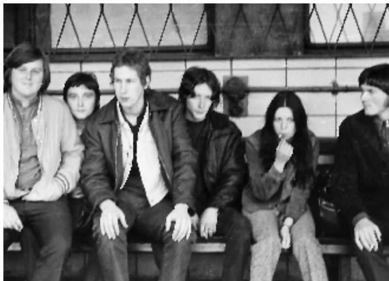
Čekání na vlak

Takhle mě viděl a fotografoval Šakal. Za divadlem, v místech, kde byla za pár let postavená budova OV KSČ.