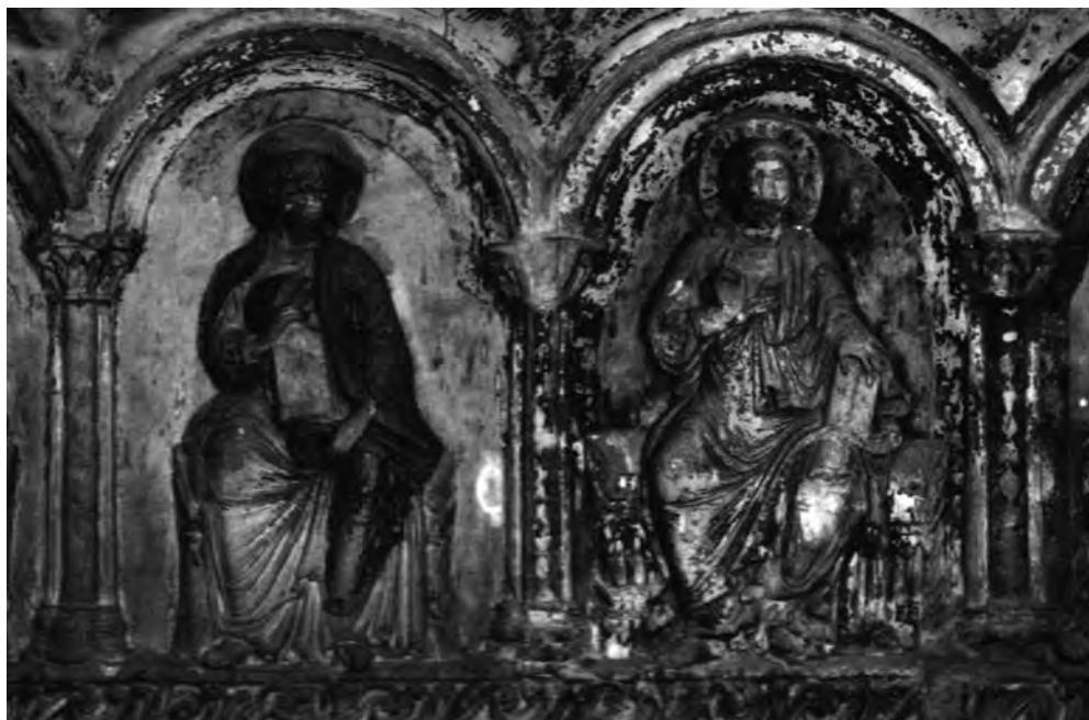
■ Štuk s dochovanou polychromií, detail (chórová přepážka, Halberstadt)