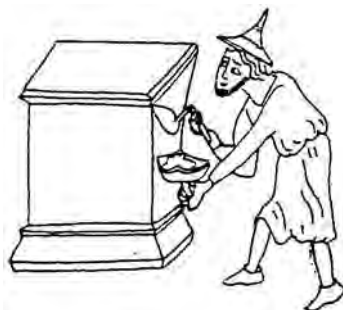
■ Středověký omítkař (ze střed. kodexu bible moralisée)

Sádrové odlitky, nahrazující drahé a časově náročné kamenické práce, se v merovejském období velmi rozšířily. Svědčí o tom nález sádrových sarkofágů z období 7. až 9. století z okolí Paříže, jmenovitě ze Saint Denis, kde se našlo více jak 2000 takových sádrových sarkofágů, odlévaných do jednoduchých dřevěných forem. Velmi úsporná reliéfní výzdoba ukazuje, že sloužily jen pohřebnímu účelu, nahrazovaly ozdobné rakve. Důvodem pro užití této techniky byl nejen výskyt bohatých ložisek sádry na území Paříže, známý již Římanům, ale také fakt, že sádrové sarkofágy bylo možno zhotovovat velmi rychle. Nálezy potvrdily, že se v blízkosti tehdejších hřbitovů vyráběly i do zásoby.