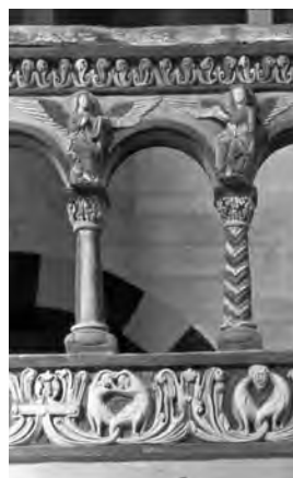
■ Detail arkády