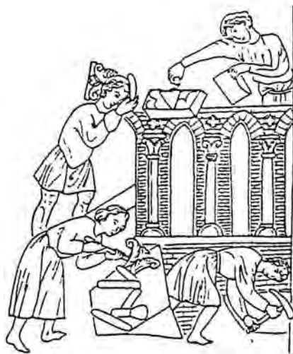
■ Opracování štukové hlavice nožem (vitraj v katedrále v Rouenu, kol 1220)