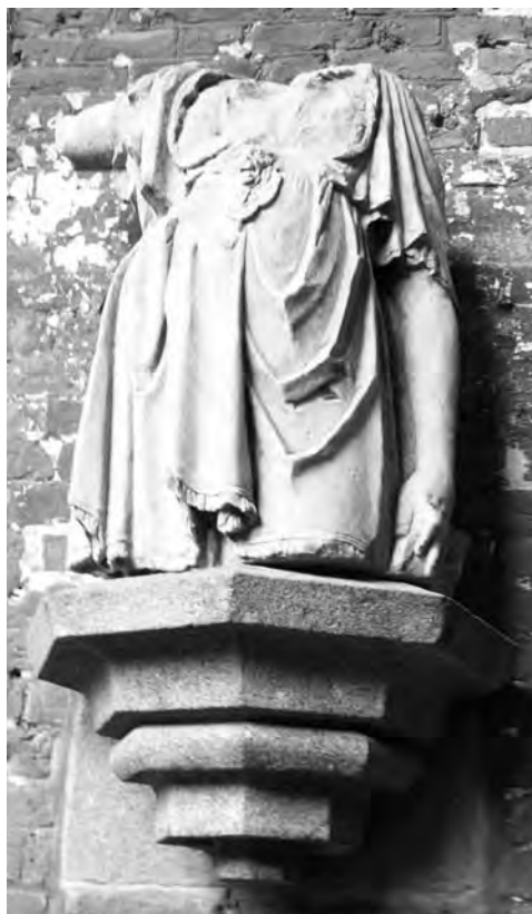
■ Torzo štukové plastiky (Malbork 14. stol.)

opracovatelný materiál přímo v dílně namísto obtížného získávání a riskantní dopravy bloků jemné opuky nebo vápence, které se i v místech jejich výskytu velmi obtížně vybíraly, protože se v požadované kvalitě vyskytovaly jen v některých faciích. Umělý kámen, připravovaný téměř výhradně z vysokopálené (estrichové) sádry má načervenalý tón, způsobený příměsí železa. Byl proto barevně upravován – většinou použitím vápenného mléka a tzv. kamenné barvy šedého odstínu – ještě před vlastním polychromním pojednání.