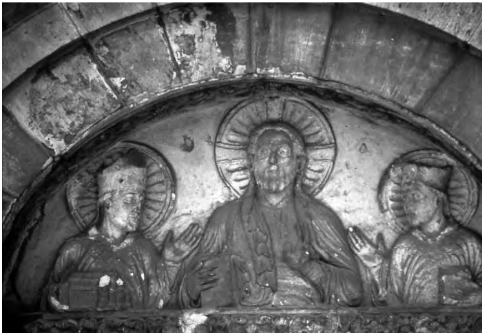
■ Štukový tympanon (St. Godehard, Německo)

(řezaném) štku a zahrnující i architektonické články (např. zdvojené sloupky před apsidami), suverenitu ve zpracování tohoto materiálu.