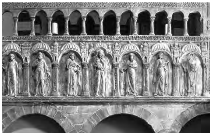
■ Chórová přepážka, štuk (sv. Michael, Hildesheim)

Snad nejstarším dokladem z období ranného středověku je štuková výzdoba baptisteria ortodoxních v Ravenně (z poloviny 5. století) a tzv. langobardské kaple v kostele sv. Maria in Valle v Cividale (8. stol. n. l.). Zde zdobí průčelní stěnu 6 postav světic („svatých žen“), provedených ve vysokém reliéfu a zřetelně modelovaných nanášením. Strnulé sloupovité a protáhlé postavy mají velmi jemně a detailně provedené záhyby šatů, které jsou zdobené bohatými výšivkami a šperky. Stojí na římsce, tvořené ornamentem osmipaprscitých květů, jejichž výrazná až ostrá modelace a pravidelný raport prozrazuje užití formy. Celek svědčí o vysokém stupni štukatérského umění. Podobně kostel v Germigny de Prés, který postavil Theodulf, přítel Karla Velikého, a který pochází z 9. století, prozrazuje svou bohatou výzdobou, provedenou v modelovaném a rytém