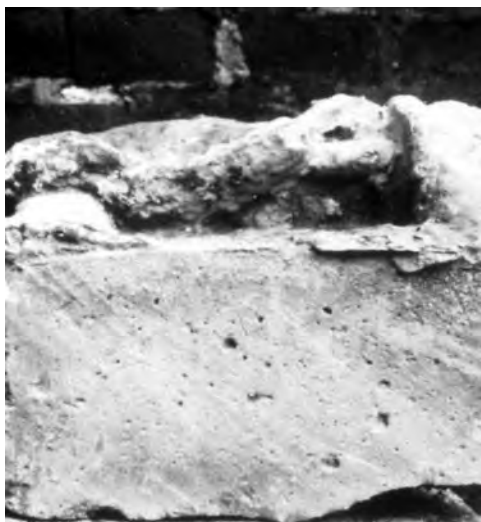
■ Vzduchové bubliny v litém bloku štuky, z něhož byla vyřezána hlavice (klášter Ebsdorf)