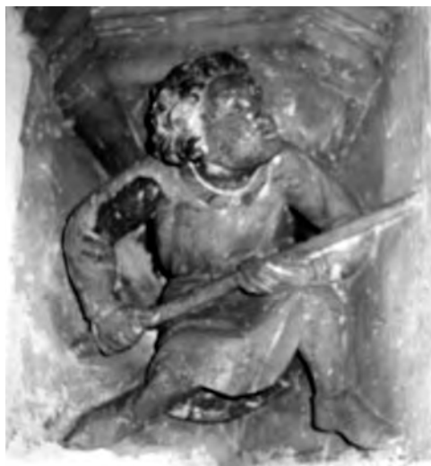
■ Štuková konzola (Malbork, 14. stol.)