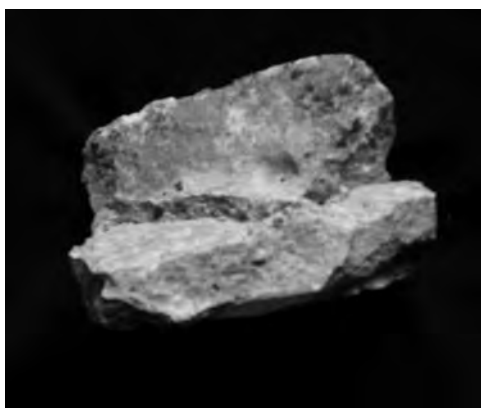
■ Litá štuková podlaha – estrich, dobře patrné dvě vrstvy (sv. Michael, Hildesheim, 12.stol.)