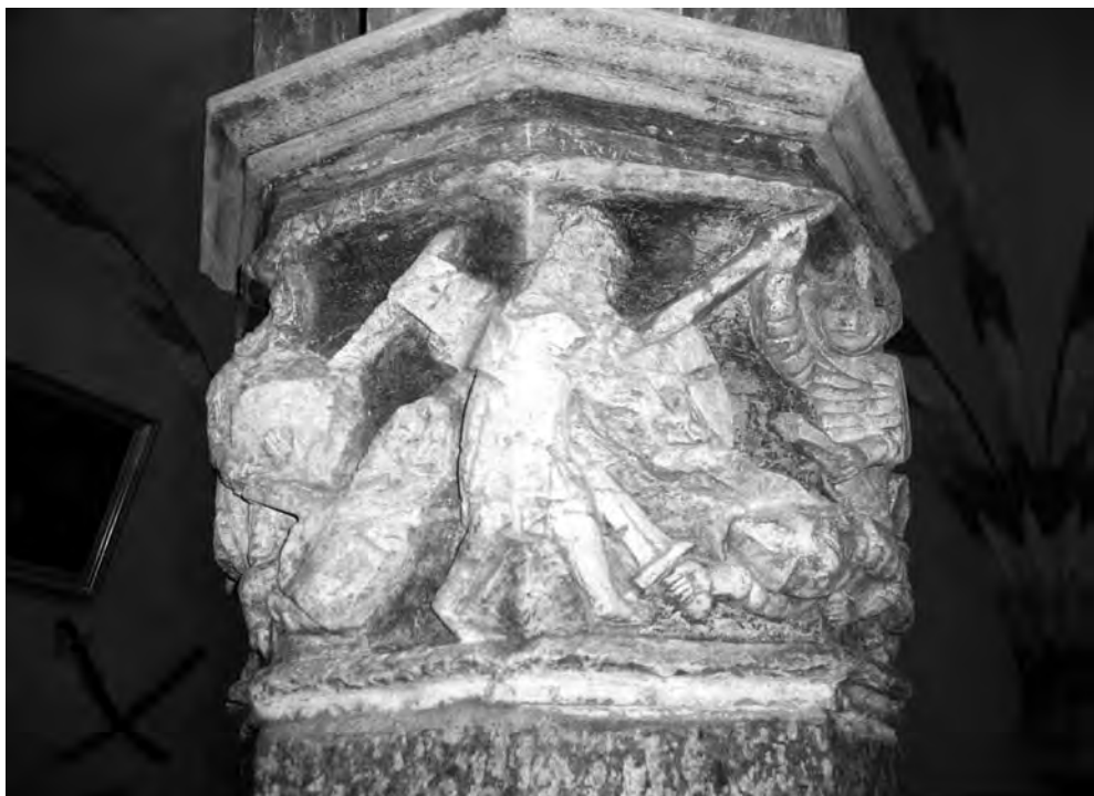
■ Štuková hlavice (Malbork, 14. stol.)

nika užití pomalu tuhnoucí sádry coby materiálu nahrazujícího kámen. Sádra je odlévána do bloků a zpracovávána běžnou technikou kamenických a řezbářských dílen, tj. dlátý a noží. Vzniká tzv. litý kámen, specifická technika užívaná především v zaalp-ských zemích. Podle rakouského badatele Manfreda Kollera, který se touto technikou podrobně zabývá, je objev litého kamene připisován salcburskému arcibiskupovi Thiemovi († 1110), což je ovšem jen pozdější legenda.