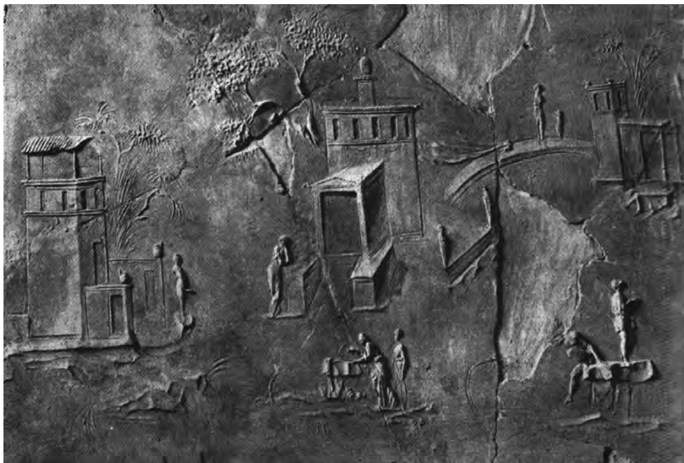
■ Renesanční štuková výzdoba (Villa Farnesina, Řím)

Nicméně za nejstarší práce ze štuky jsou obecně považovány portréty Amenhotepa II., jeho syna a předních členů jeho dvora z Tell el-Amarny, pocházející z 18. dynastie (1567–1320 př. n. l.). Vedle umění štukového reliéfu se uplatňoval tento materiál ve formě jemné štukové vrstvy na plastikách z měkkého vápence (jako např. na známém portrétu královny Nofretete), kde sloužil jako podklad pro polychromii. V Nové říši pak sloužil štuk jako běžný materiál povrchových úprav dřeva. Není divu, jeho hlavní pojivo – sádra – pocházelo z hojných místních zdrojů a sloužilo nejen jako stavební pojivo (ložná malta celé řady staveb, mj. i pyramid, obsahuje sádru), ale jako plastický materiál při úpravě stěn chrámů a hrobových komor a také pro úpravu honosných dře-