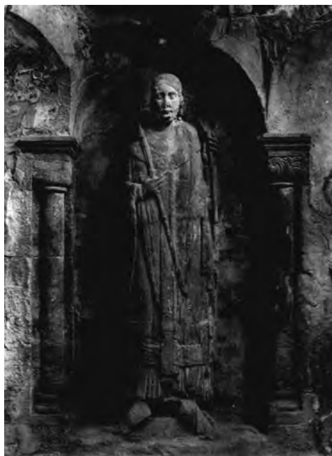
■ Plastika vytvořená řezbářským opracováním odlitého bloku (Gernrode, klášterní kostel, 12. stol.)