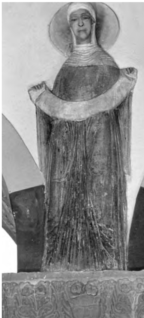
■ Štuková plastika interiéru kostela sv. Michaela (Hildesheim)

(Corvey, Halberstadt) odhalily osikové a dubové kolíčky, kterými byly reliéfní plastiky upevněny k pozadí.